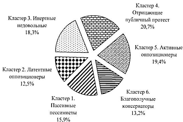
Рисунок - Классификации населения Орловской области по протестному потенциалу.

Во втором параграфе – «Классификация населения региона по уровню социальной напряженности и протестного потенциала» – в результате проведенного кластерного анализа выборочной совокупности эмпирической базы авторского исследования по протестным характеристикам выявлены следующие кластеры населения Орловской области (рисунок).