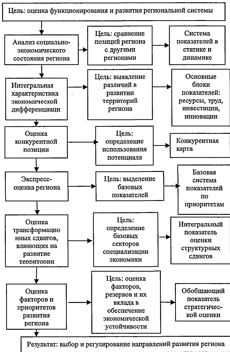
Рис.1. Этапы комплексной оценки потенциала, функционирования и развития региона.