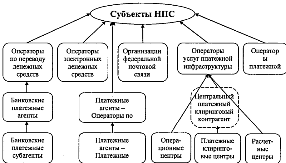
Рисунок 1. Принципиальная схема организации НПС (в зависимости от субъектов)

При этом под участниками ПС понимаются организации и предприятия различных организационно-правовых форм, обязующиеся выполнять правила ПС в целях оказания услуг по переводу денежных средств (см. рисунок 1).