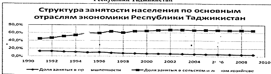
Рисунок Структура занятости населения по основным отраслям экономики Республики Таджикистан

В диссертации кратко подвергается анализу уровень занятости населения домохозяйств. Тяга к труду определяется предельным продуктом производимым работником. Превалирование ручного труда делает проблемным производством предельного продукта, которая является основой производства прибыли. Кроме этого тяга к труду определяется оплатой труда, которая удовлетворяет потребности члена домохозяйств. Если этот уровень оплаты труда не соответствует потребностям, работник ищет другую работу. Ее, граждане находят в трудовой миграции. Так примерно из 1,5 млн. чел. проживающих в горных районах, в трудовой миграции находятся 300 тыс. чел. в странах ближнего зарубежья. В районах Согдийской области по экспертным оценкам, около 15% трудоспособного населения являются трудовыми мигрантами.