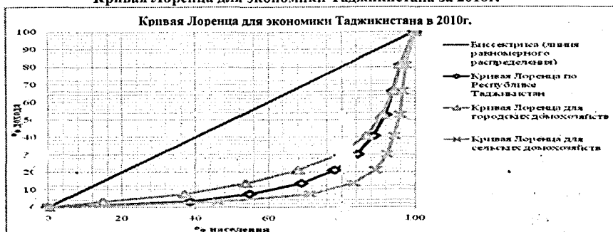
Кривая Лоренца для экономики Таджикистана за 2010г.

*Составлено по: Основные показатели обследования бюджетов домашних хозяйств. Душанбе: 2011г.- С. 19-21.