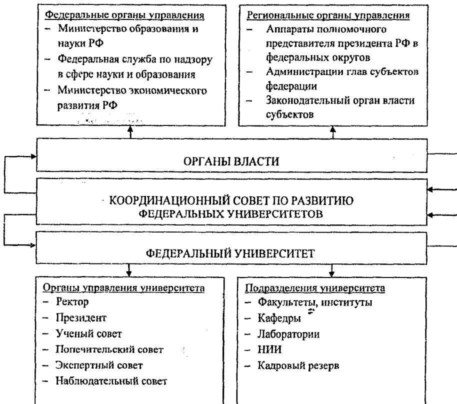
Рис 2. Организационная модель управления федеральными университетами Разработано автором

В процессе создания Координационного совета по развитию федеральных университетов участники постоянно действующего совещания проходят несколько этапов, начиная от делегирования представителей для участия в совете и утверждения регламентов его функционирования, заканчивая реализацией рекомендаций, оценкой программ развития федеральных университетов и аудитом их деятельности. Кроме того, предполагается, что совет будет разрабатывать рекомендации, касающиеся основных направлений развития образования, выпускать специальные периодические издания и множество работ монографического характера. В его задачи войдет проведение долгосрочных исследований, которые призваны содействовать качественному улучшению подготовки кадров и более рациональному использованию