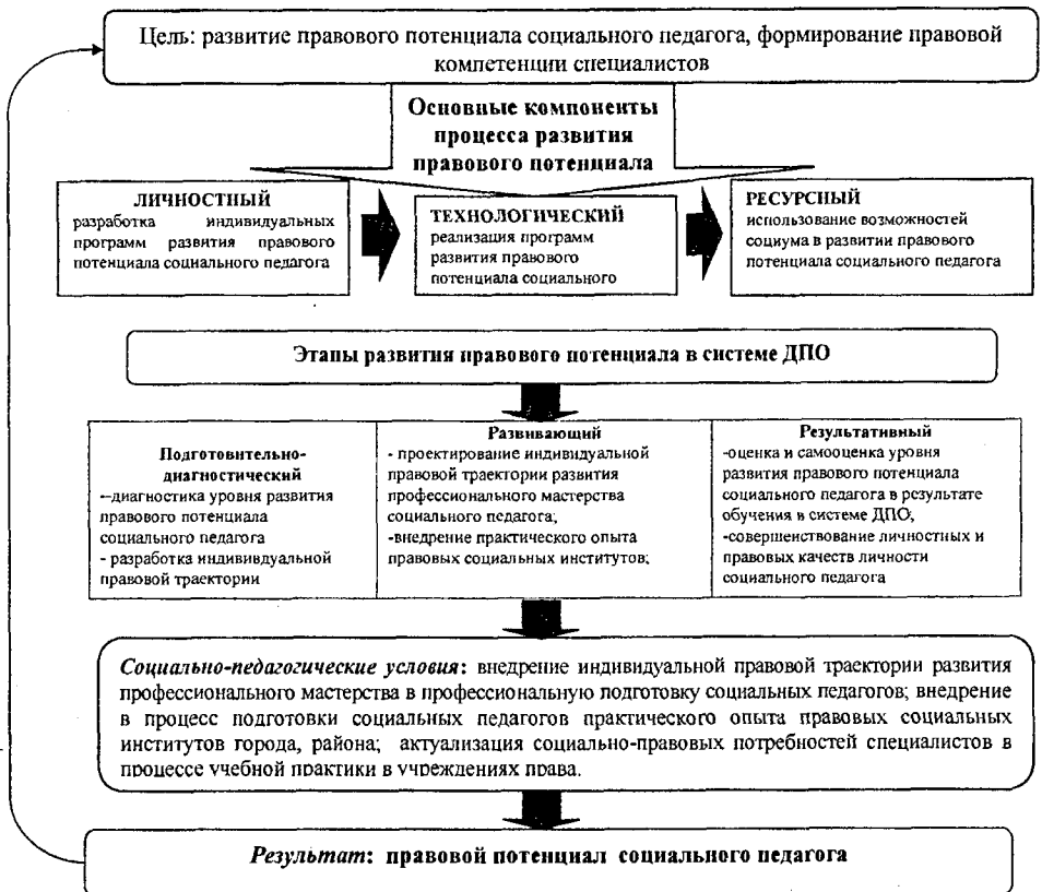
Рис.2. Модель процесса развития правового потенциала социального педагога в системе дополнительного профессионального образования

В диссертации на основе исходных показателей приводится обоснование разработанной автором модели процесса развития правового потенциала социального педагога в системе дополнительного профессионального образования (См.: Рис.2).