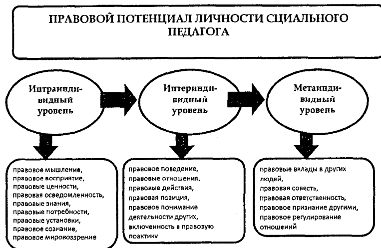
Рис.1. Структура правового потенциала личности социального педагога

Представленные в диссертационном исследовании уровни развития правового потенциала подвели нас к формулировке понятия «проектирование индивидуальной правовой траектории развития профессионального мастерства социального педагога» - это специфическая технология, представляющая собой конструктивную, творческую деятельность, сущность которой заключается в анализе проблем развития правового потенциала социального педагога и выявлении причин их возникновения, выработке целей и задач, способствующих повышению эффективности процесса развития правового потенциала социального педагога в системе дополнительного профессионального образования, разработке путей и средств достижения поставленных целей.