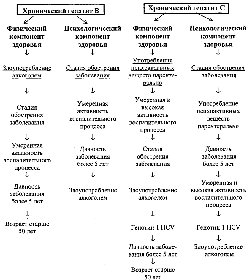
Рисунок 1. Неблагоприятные факторы, определяющие низкое качество жизни больных хроническими гепатитами В и С по убыванию

Изучив факторы, которые являются определяющими для КЖ больных, мы задумались о возможностях улучшения показателей КЖ. Для этого можно использовать медикаментозные методы лечения и профилактические программы.