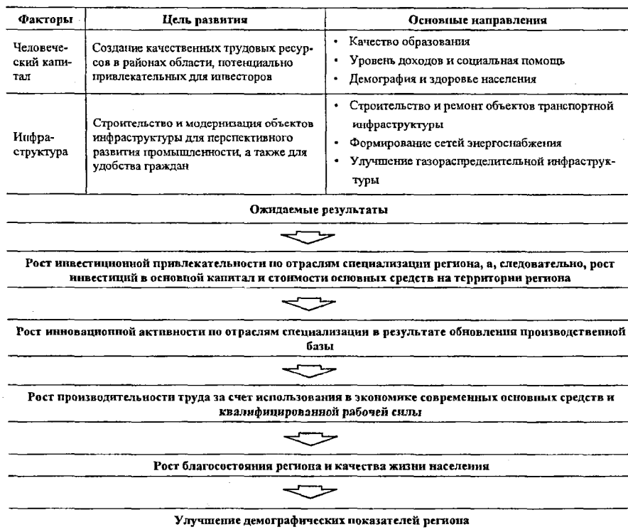
Рис. 3 Факторы развития депрессивного региона, подверженные управленческому воздействию региональной власти, и их влияние на изменение социально-экономического положения субъекта РФ (составлено автором)

ловеческого фактора. В частности, модернизация системы образования в депрессивном регионе может быть проведена преимущественно с опорой на собственные ресурсы, при ограниченной поддержке федеральной власти. В среднесрочной и долгосрочной перспективе наибольший положительный эффект для экономики субъекта РФ будет иметь политика региональных властей, направленная на улучшение его инфраструктуры, что, в свою очередь, будет способствовать повышению инвестиционной привлекательности и реализации новых инвестиционных проектов (см. рис. 3).