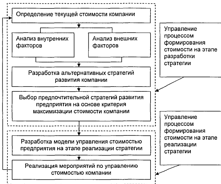
Рис. 2. Структура цикла управления стоимостью предпринимательских структур

3. Разработка альтернативных стратегий развития компании. На основе анализа внутренних и внешних конкурентных преимуществ разрабатываются возможные альтернативные стратегии развития бизнеса и оценивается его стоимость, которая может быть достигнута в результате реализации каждой из стратегий;