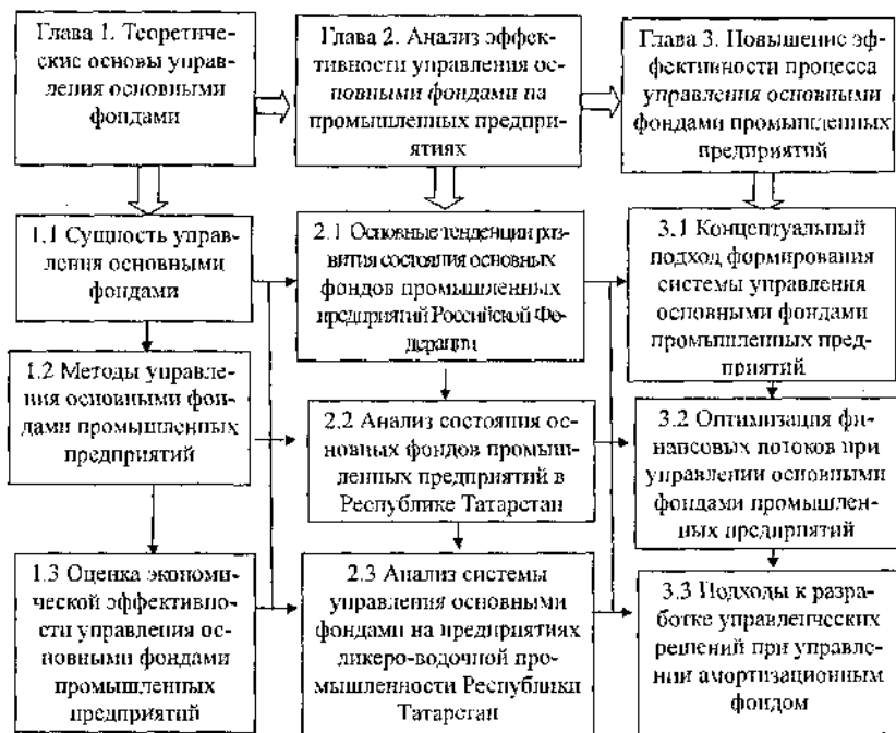
Рис. 1. Схема диссертационного исследования

цессе при преподавании экономических дисциплин и в научно-исследовательской работе.