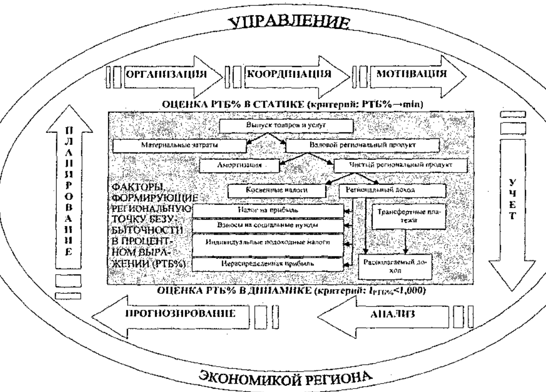
Рис. 3. Управление экономикой региона по критерию снижения региональной точки безубыточности