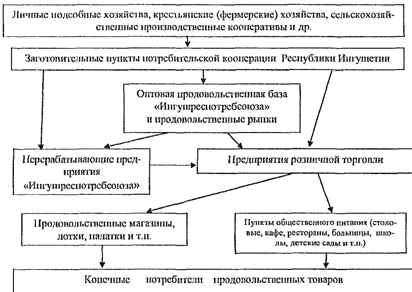
Рис.2 - Логистическая цепь деятельности «Ингушреспотребсоюза» на продовольственном рынке