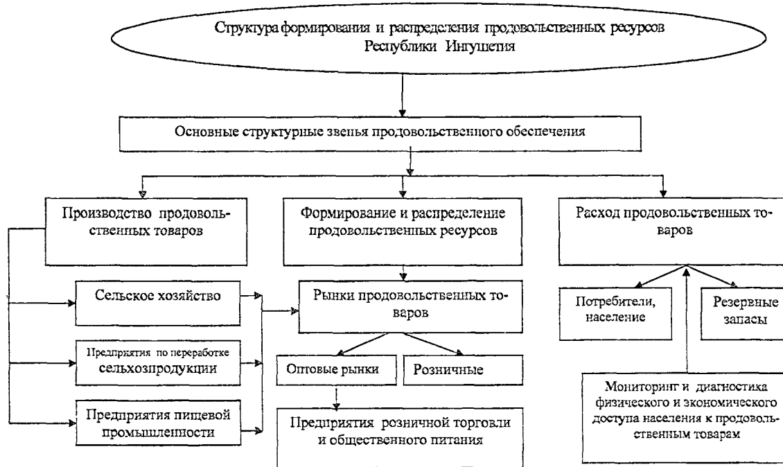
Рис.3. Схема продовольственного обеспечения Республики Ингушетия