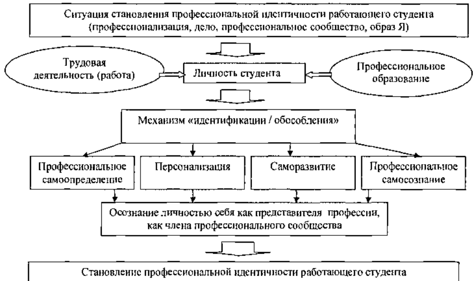
Рис 1 Становление профессиональной идентичности работающего студента

самосознания и самоотношения как аспектов проблемы Я Развитие личности в деятельности и становление ее профессиональной идентичности происходит через механизм идентификации и обособления Идентификация представляет собой процесс эмоционального и иного самоутверждения человека с другим человеком, группой, образцом, а обособление помогает сохранению своей уникальной индивидуальности, в основе которой лежат потребности в развитии и росте, в свободе и познании себя Становление профессиональной идентичности рассматривается в рамках профессионального самоопределения, развития, ответственности за профессиональные действия и отношения Теоретический анализ основных подходов к изучению становления профессиональной идентичности в психологии применительно к ситуации профессионализации студентов позволил наглядно отобразить ее в схеме (см рис 1)