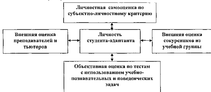
Схема проверки успешности адаптации студентов к обучению по выделенным критериям.

Многократное изучение одних и тех же студентов в течение полутора лет и применение многомерного анализа дали возможность построить описание и интерпретацию полученных результатов.