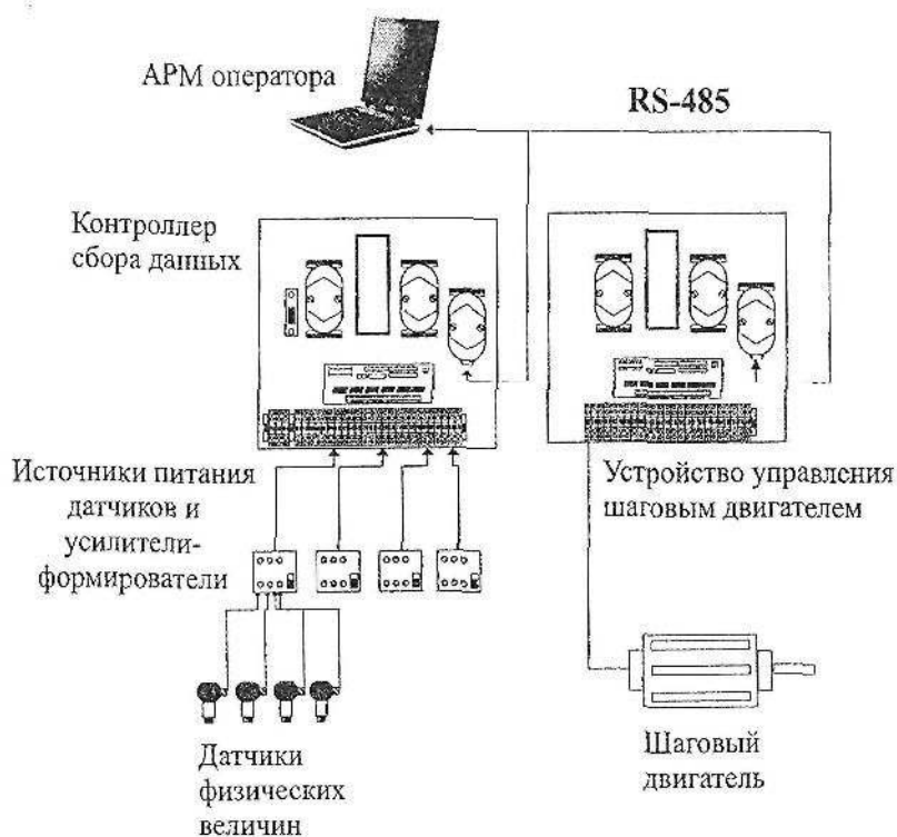
Рис. 1. Структурная схема комплекса для сбора и регистрации данных.

наземного и глубинного исполнения. Блок вторичной регистрирующей аппаратуры имеет два варианта исполнения. На рис.1 приведена схема комплекса сбора и регистрации данных гидродинамических исследований по самопрослушиванию.