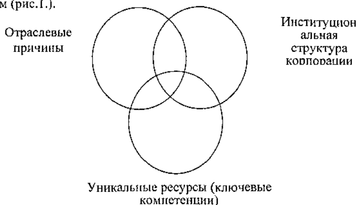
Рис. 1. Схема составляющих институционально-ресурсного подхода

Суть предлагаемого нами институционально-ресурсного подхода состоит в том, что присущая фирмам неоднородность может быть устойчивой ввиду обладания ими уникальными ресурсами (ключевыми компетенциями) и институциональной структурой, которые именно в определенных отраслевых условиях – что особенно ярко проявляется в ТЭК - являясь источниками экономических рент, определяют конкурентные преимущества конкретных фирм (рис.1.).