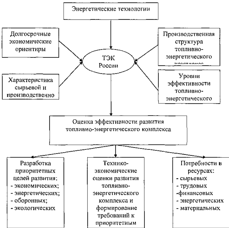
Рис. 4. Схема формирования организационно-экономических направлений глобализационной стратегии развития корпоративных структур топливно-энергетического комплекса России

В рамках глобализационной стратегии развития перед корпорациями ТЭК России должны быть решены следующие задачи: