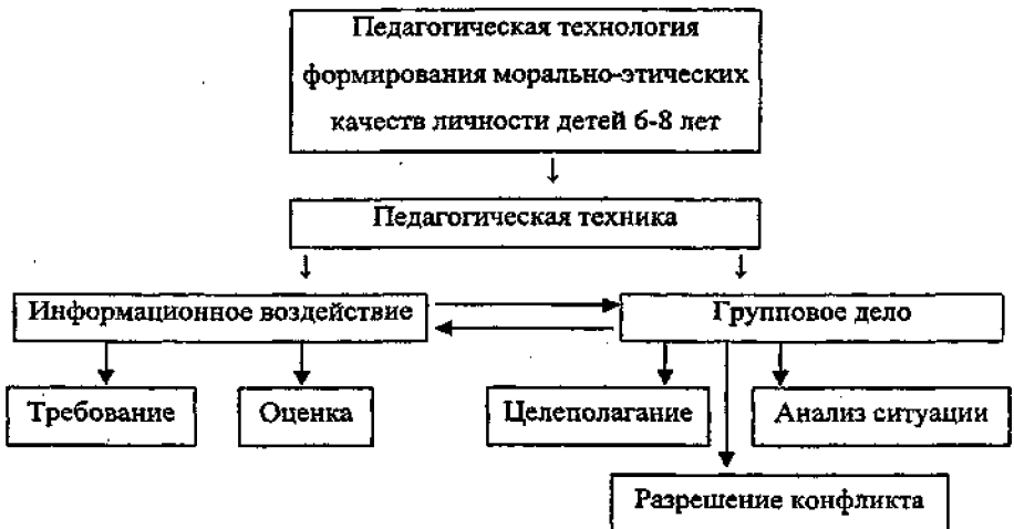
Рис.1. Схема педагогической технологии формирования морально-этических качеств личности детей 6-8 лет.

2. Отсутствие жесткой соподчиненности этапа информационного воздействия и организации группового дела, они включаются одновременно и могут оказывать одномоментное воздействие.