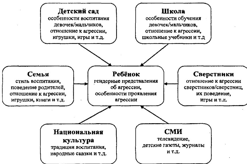
Рис. 1. Влияние наиболее значимых институтов и факторов гендерно асимметричной социализации на особенности проявления агрессии мальчиками и девочками

Во второй главе диссертации «Лонгитюдное исследование проявлений агрессии у мальчиков и девочек и влияния гендерно асимметричной социализации на их развитие» описывается организация и ход исследования, дана характеристика выборки, изложены и обоснованы методы исследо-