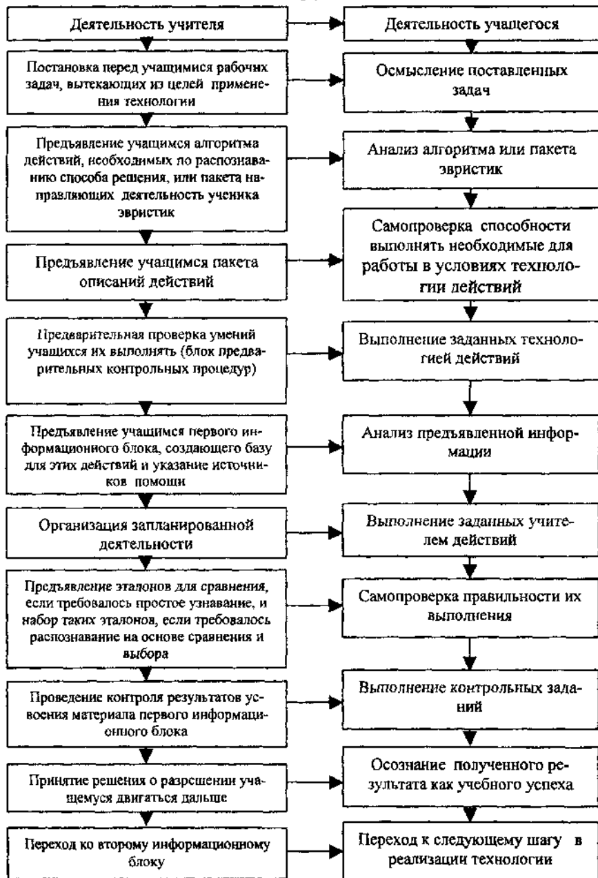
Рис. 1. Взаимодействие учителя и учащегося в процессе реализации педагогической технологии