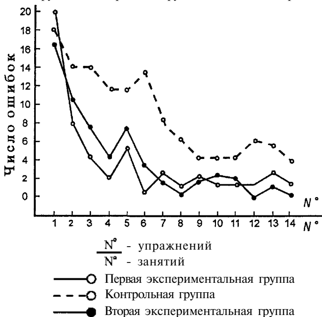
Рис. 2 Число ошибок при овладении навыками.

Сложность на этом этапе заключалась в том, что точность и правильность приёма работы при вышивании позднее закреплялись, устраняя ошибки. Анализируя рис.2 нужно отметить, что в первой и второй экспериментальных группах после четвёртого занятия (до этого проводились 9 упражнений) уменьшилось число ошибок, хотя затрата времени была выше в контрольной группе. В контрольной группе число ошибок продолжалось до