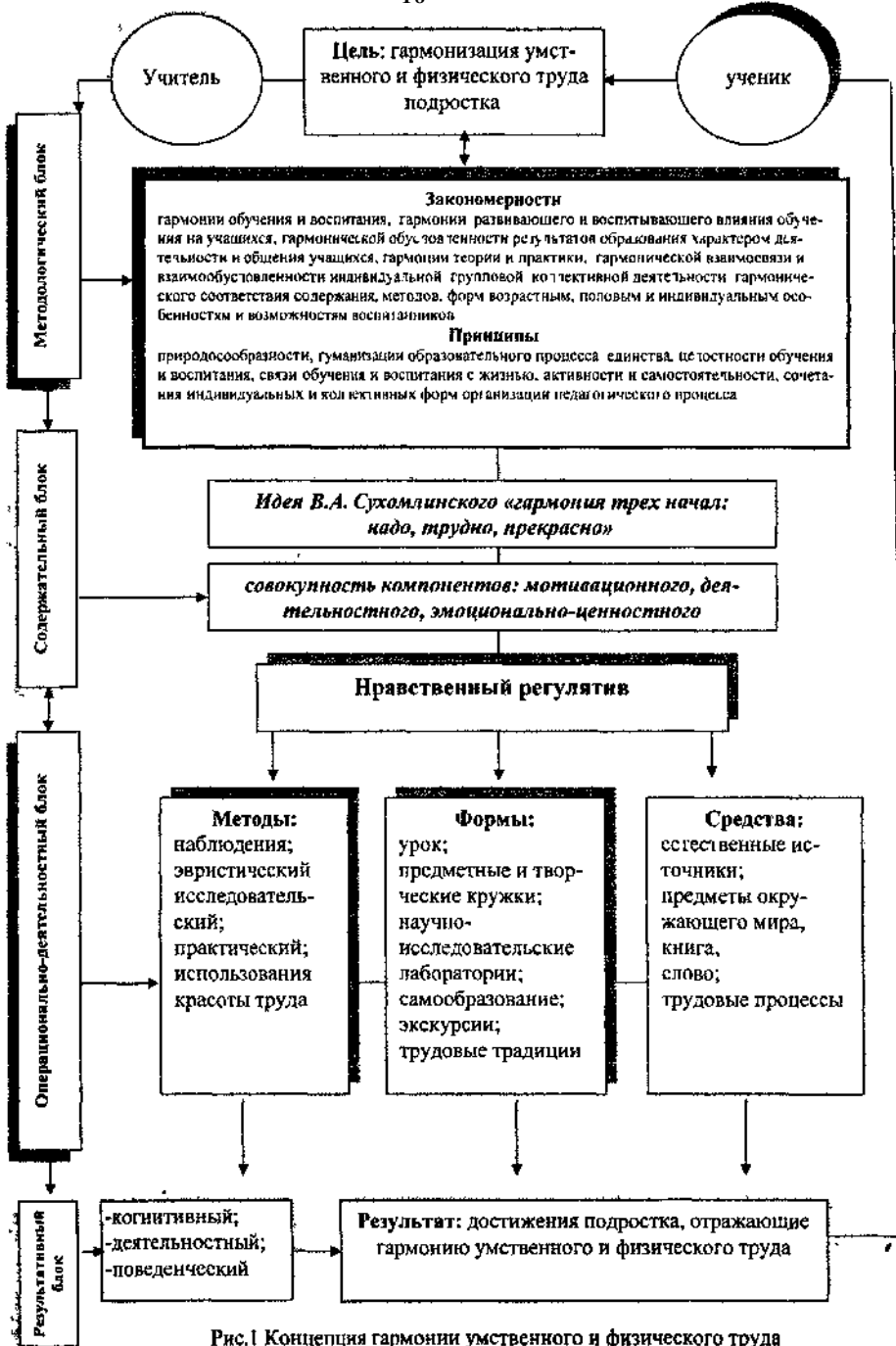
Рис. 1 Концепция гармонии умственного и физического труда подростка в педагогическом наследии В.А.Сухомлинского