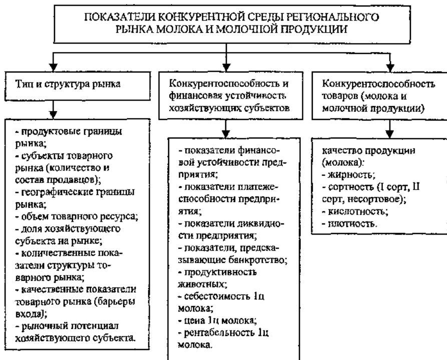
Рис. 1. Система оценки конкурентной среды регионального рынка молока и молочной продукции

ториальных единиц). Мы считаем, что уровень развития конкурентной среды должен постоянно, систематически оцениваться с помощью определенной системы показателей. В работе предложена и обоснована такая система применительно к конкурентной среде регионального рынка молока, включающая три группы показателей, с разных сторон оценивающих развитие этого рынка (рис. 1).