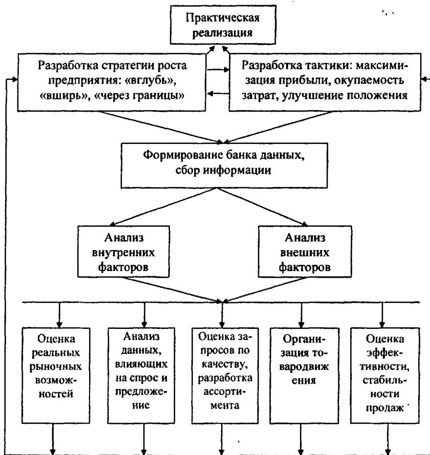
Рис. 1. Алгоритм управления коммерческой деятельностью предприятий молочной промышленности регионального АПК

Научная организация управления коммерческой деятельностью подразумевает наличие определённого алгоритма управления (рис. 1).