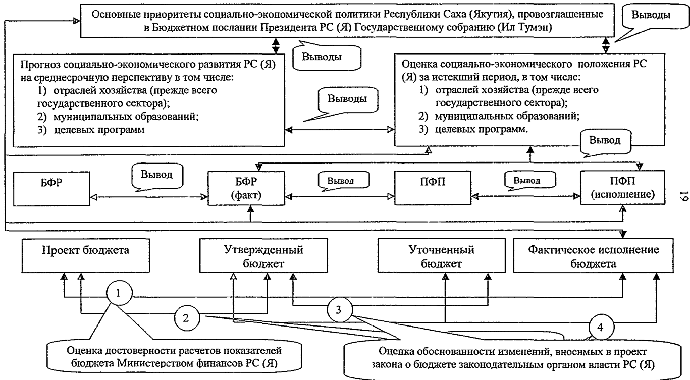
Рис. 1. Основные этапы экономического анализа уровня исполнения бюджетных показателей